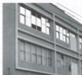
上の階の窓は飛散防止フィルムを施工。下の階は未施工。

さらに、より強力な「スーパーセキュリティフィルム」シリーズや省エネルギー効果の高い「日照調整フィルム」などの機能性を高めた製品もラインナップしています。