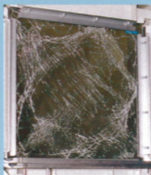
層間変位破壊実験【JIS A 5759 B法】▶

窓枠の変形によって、ガラスは粉々に割れてしまい、飛散防止フィルムによって支えられた状態になったが、ガラス粉がわずかに散っただけで、ガラス片の飛散や落下は防いだ。