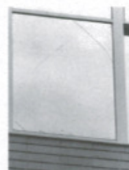
飛散防止フィルムを施工した窓ではガラスが破損しても飛散を防ぎました。