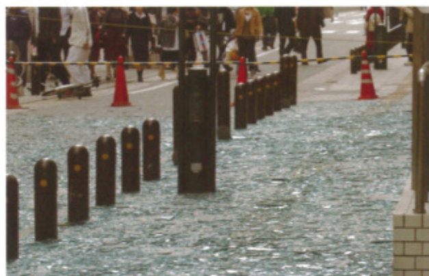
地震によって硬化性パテ止めのはめごろし窓のガラスが破損し、路上に落下・飛散した。

大きい地震のたびに建物のガラス窓が大量に割れる事故が報告されています。とくに1978年の耐震基準改正前に建築されたビルに多い【硬化性パテ止めのはめごろし窓】は地震の揺れを吸収できずに破損しやすいとされています。1978年の宮城県沖地震でガラス窓の破損事故が多発したことを受けて出された、建設省「ガラス窓の調査及び改修指導について」で、このような窓ガラスは破損時の飛散を防止する改修をするよう通知されています。しかし、全国にはまだ改修されていない窓ガラスが多数あると思われる、2005年3月に国土交通省から「既存建築物における窓ガラスの地震対策について」(通知)が出されました。